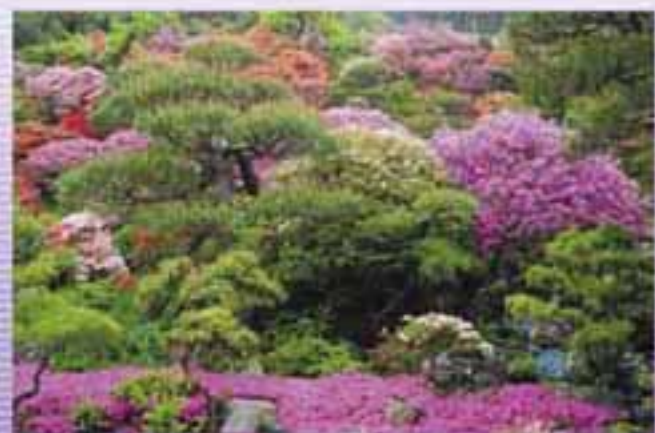
船子のツツジ山も見事に咲きました（ さん宅）