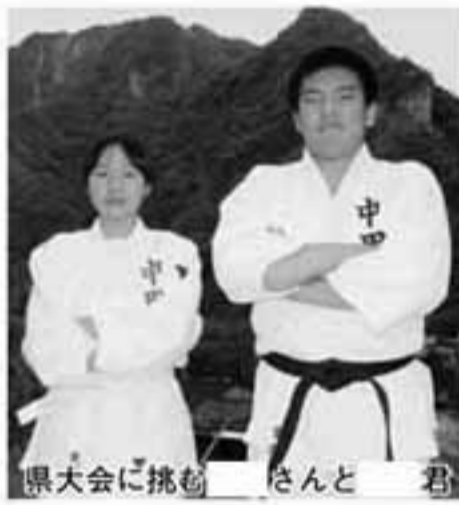
県大会に挑戦 さんと 君

▼柔道 ▽男子団体 3位 ▽男子個人 2位 50 kg級 1回戦 同 1回戦 60 kg級 2回戦 66 kg級 3回戦 73 kg級 1回戦 90 kg超級 優勝 ▽女子個人 優勝 52 kg級 優勝