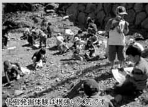
化石発掘体験は根強い人気です