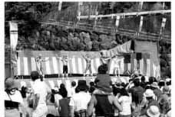
自然環境を守るために群馬が生んだ超速戦士G-Fiveも元気に活躍