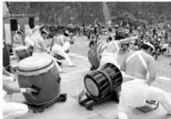
お腹に響く勇壮な和太鼓を披露してくれたのは鬼石三杉太鼓の皆さん