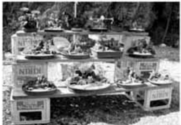
地元の素材で丹念に作られた盆栽は、郷土資源活用の道を探ります