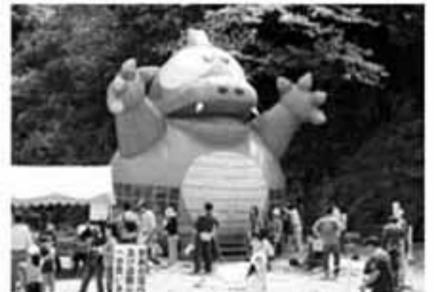
今年のフワフワは恐竜？背後には白いフジキの花が満開