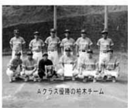
Aクラス優勝の柏木チーム