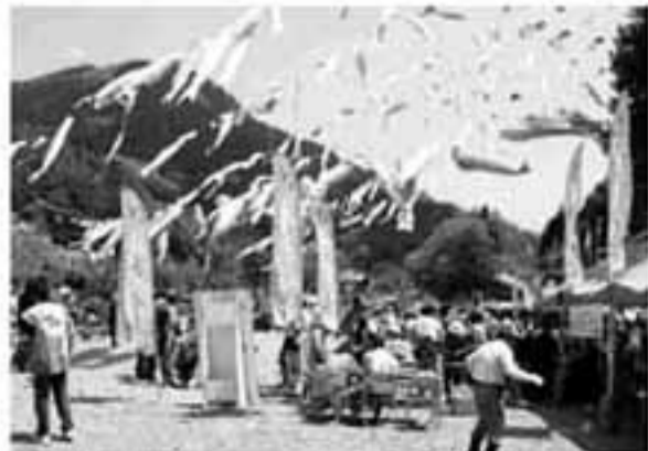
来年開催される全国都市緑化ぐんまフェアのキャンペーンも実施