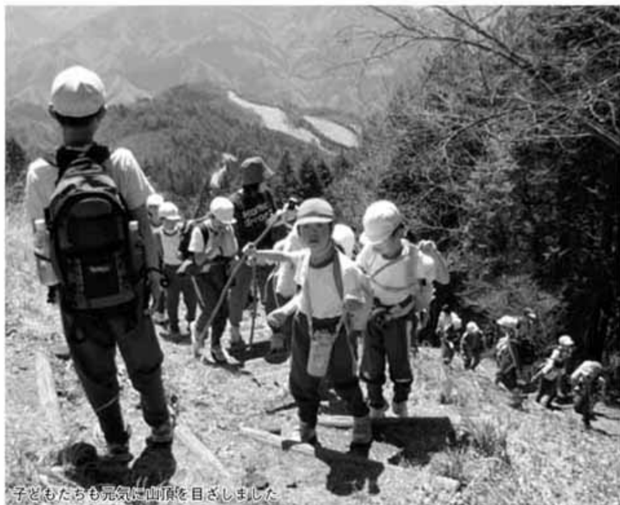
子どもたちも元気に山頂を目指しました