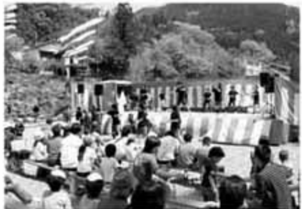
地元の子どもたち、KTRは、躍動感あふれる神流ソーラン節を披露