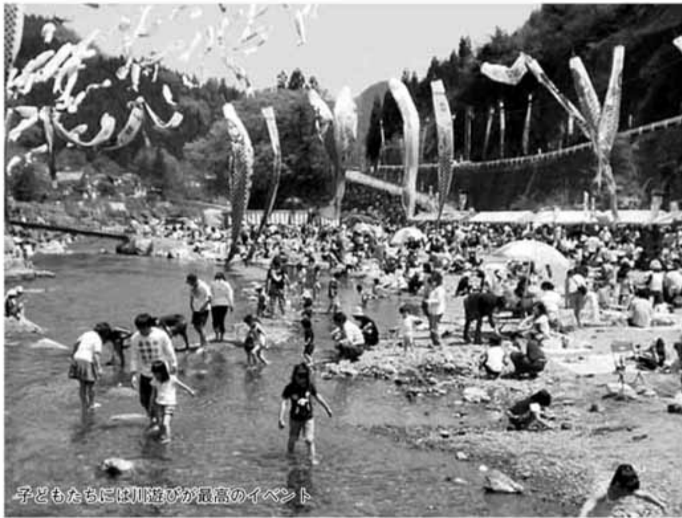
子どもたちには川遊びが最高のイベント