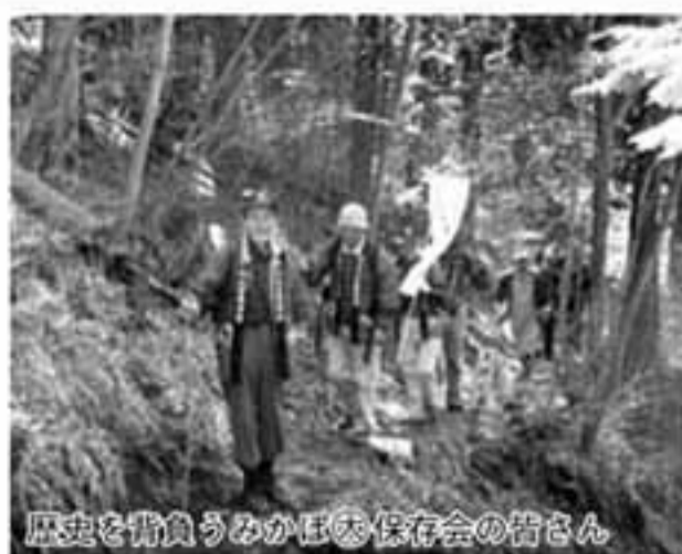
歴史を背負うみかほ保存会の皆さん