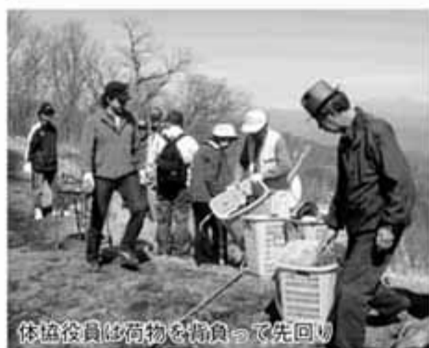
体協役員は荷物を背負って先回り