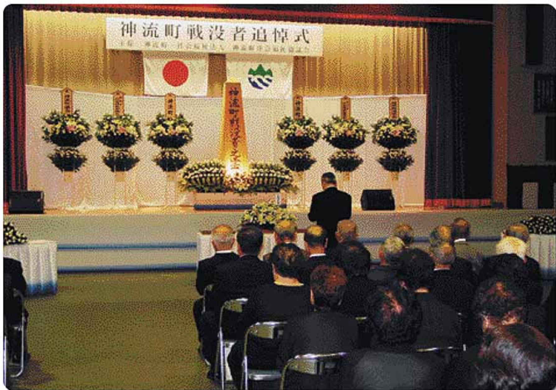
10月4日開催の戦没者追悼式