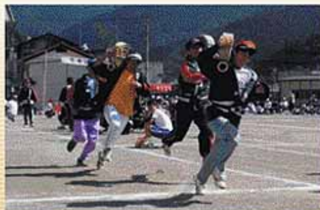
19年度体育祭がなごやかに開催されました