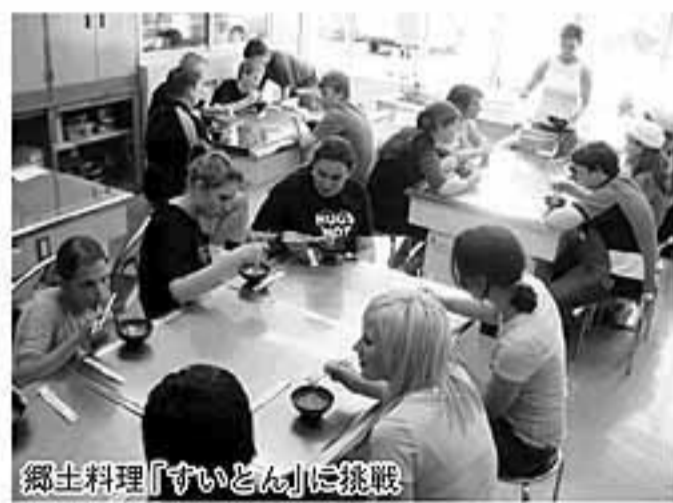
郷土料理「すいとん」に挑戦