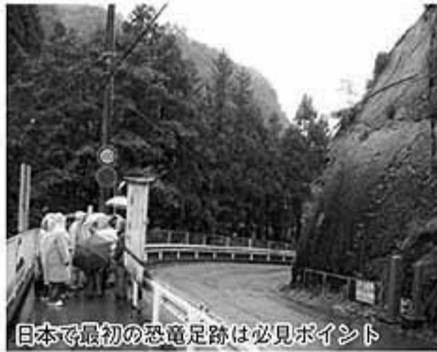
日本で最初の恐竜足跡は必見ポイント

今回はあいにくの天気ですが、楽しみにされていた化石発掘は雨で行ないました。が、アンケートを見る限りでは、みなさんそれなりに楽しんでいただけたようです。