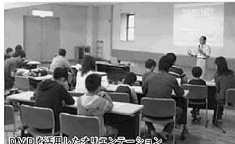
DVDを活用したオリエンテーション

今年の夏は暑かったこともあり、不二洞および恐竜センターともに夏休みの入館は昨年よりも大幅に増えました。しかし、例年9月は夏休みが終わり、紅葉前ということもあり、お客様があまり外出しない時期と言われています。また、今年には台風の影響もあり、不二洞では昨年よりも入館者数が減ったようですが、恐竜センターは、化石発掘ブーム(?)なのででしょうか、おかげさまで昨年よりも増えていきます。 今回のツアーも恐竜センターのホームページへ8月末に公表してから2週間ほどで定員(40名)となりました。その中には8月のHISのツアーで参加された親子も含まれていました。