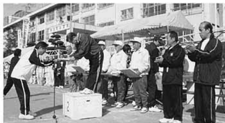
写真上下=伝達および功労表彰を受けた皆さん