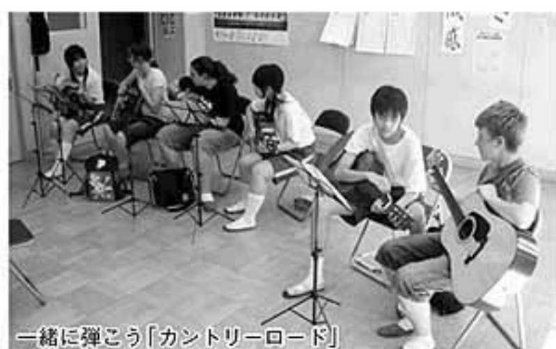
一緒に弾こう「カントリーロード」