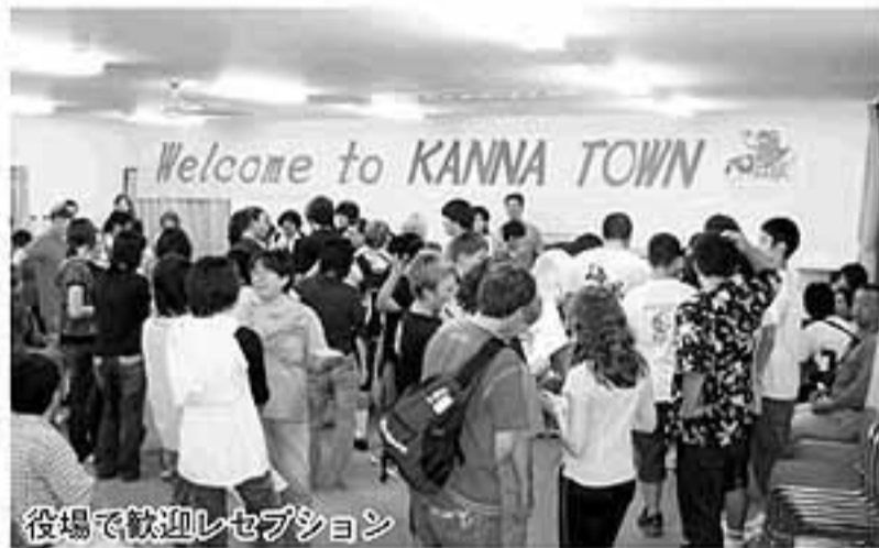
役場で歓迎レセプション