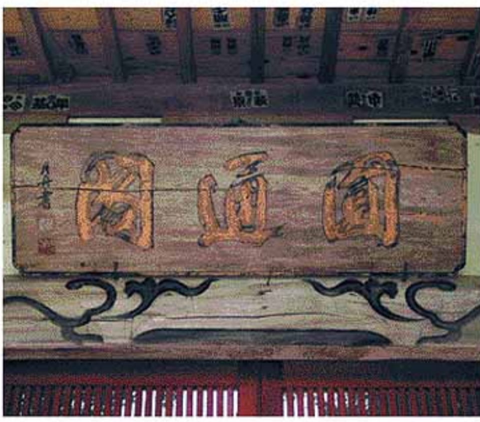
上：東福寺本堂正面に掲げられた大きな「木製扁額」 圓通閣(えんつうかく)