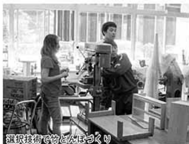
選択技術で竹とんぼづくり