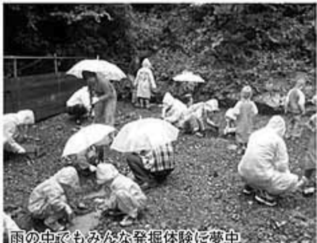
雨の中でもみんな発掘体験に夢中

現在検討しています。 なお、第8回目につきましては、11月17・18日に上野のまほーばの森で星の観賞会とセットで行なうことも決定しました。次回はもっと満足していただけたらと思う、新しい試みをやりたいと思います。 (文・恐竜センター佐藤)