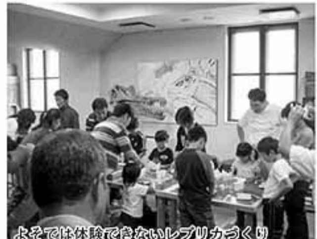
よそでは体験できないレプリカづくり