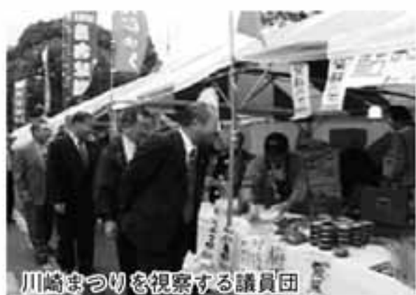
川崎まつりを視察する議員団

11月2日には、川崎まつりの状況を議会全員で視察し、市長との対話の中で都市との交流、神流町活性化の方向等を探りました。