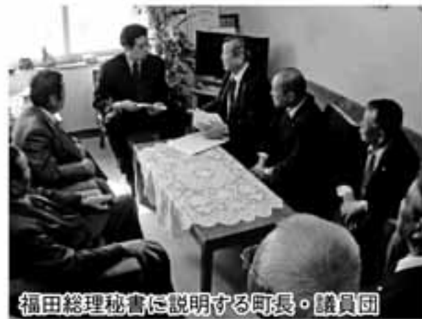
福田総理秘書に説明する町長・議員団