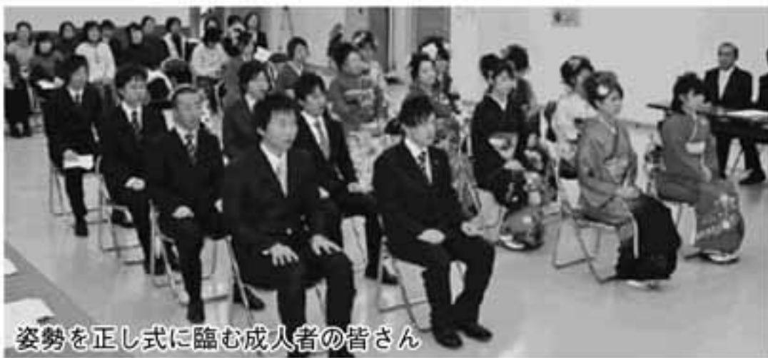
姿勢を正し式に臨む成人者の皆さん

1月13日に、鯉々鯉ランド会館において、成人式が挙行されました。該当者数24名のうち18名が出席。成人者たつての希望により、若くして亡くなった同級生の故 さんも遺影で参加しました。