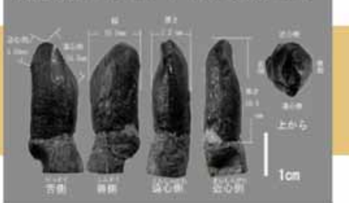
神流町産ティタノサウルス形類の歯

注：運び込んだ岩は、恐竜センターが研究用に利用するため、見つけた化石はすべて恐竜センターの所有となります。また、地権者との約束で発見現場を教えることは出来ませんので、予めご了承ください。By 恐竜センター（佐藤）