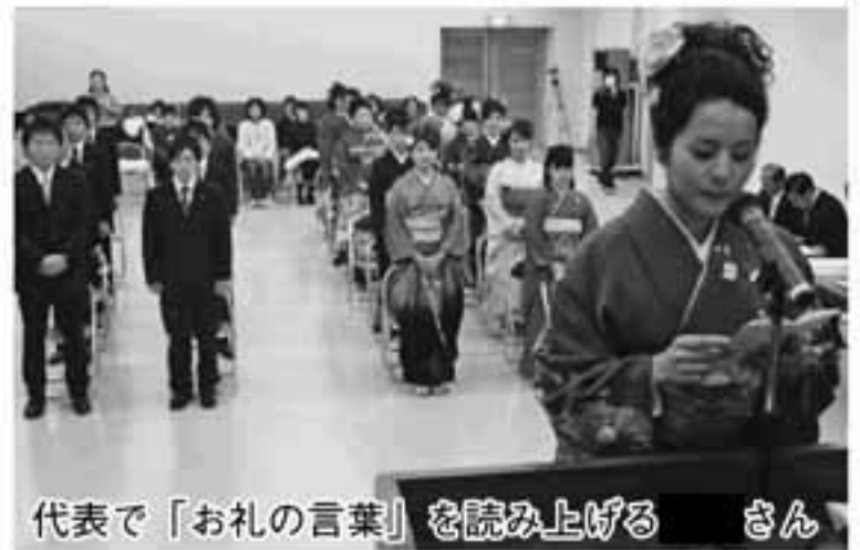
代表で「お礼の言葉」を読み上げる さん