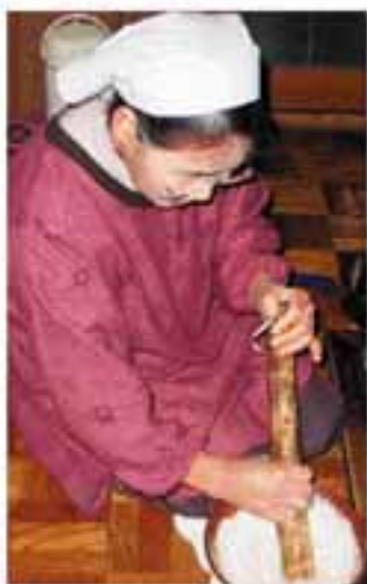
右|| 栄養たっぷりの呉汁 上|| 自家製の有機栽培大豆を、すり鉢ですり潰す