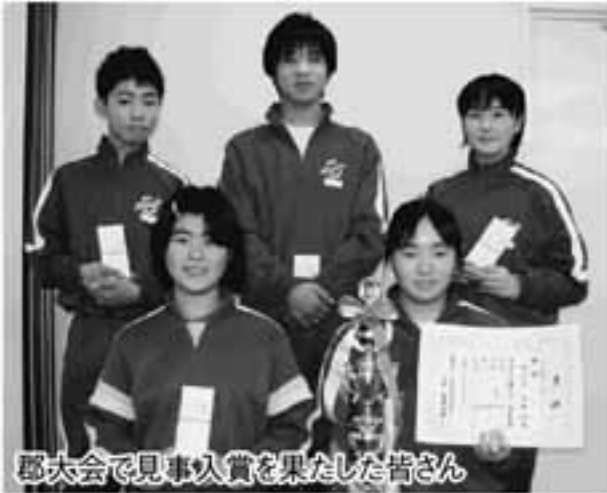
郡大会で見事入賞を果たした皆さん