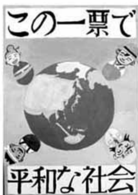
中1 ( )