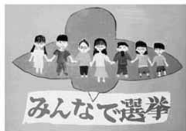
中2 ( )