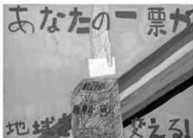
小6 ( )