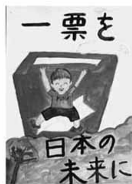
小6 ( )