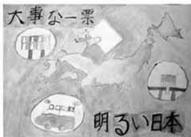
小6 ( )