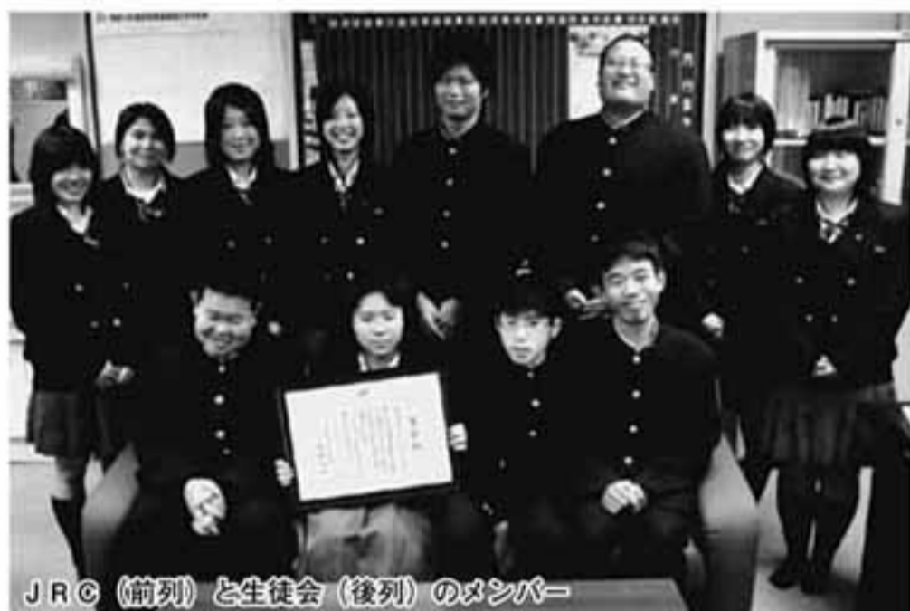
JRC (前列) と生徒会 (後列) のメンバー

歳末たすけあい運動の一環で、万場高校が行っている街頭募金は、30年以上も続いている伝統的な活動です。