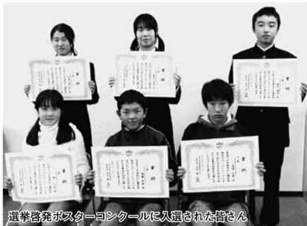
選挙啓発ポスターコンクールに入選された皆さん

県選挙管理委員会が主催する18年度 明るい選挙啓発ポスターコンクールで、 町の入選となった作品は6点。どれも 力作でした。 19年度は、身近な町長選挙を含め、 多くの選挙が執行されます。町の子ど もたちの啓発に応えられるよう、有権 者の皆さんも、どうぞ明るい選挙にご 協力ください。