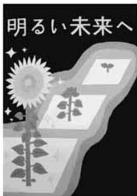
中2 ( )