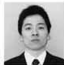
④③②① ④丸岩の松のよう に強く生きる