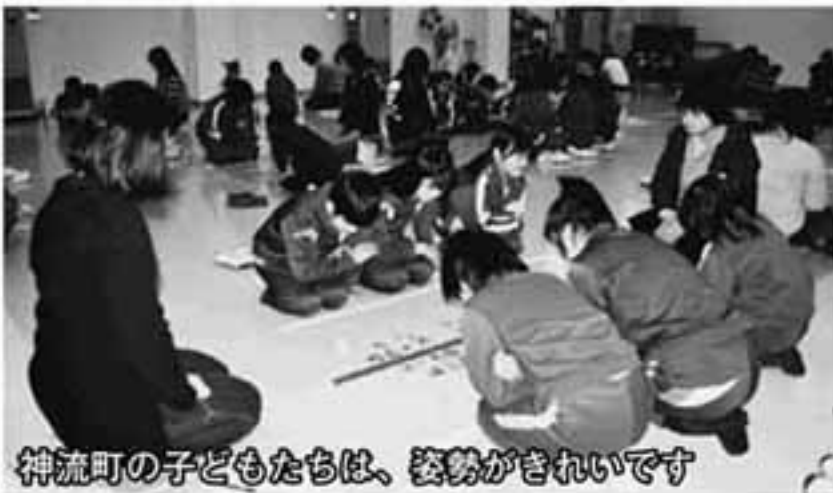
神流町の子どもたちは、姿勢がきれいです