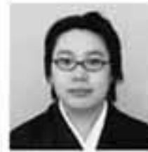
④③②① ④人に優しく行く先々で頑張る