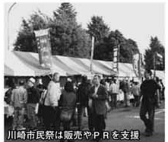
川崎市民祭は販売やPRを支援

者とも合流し、会の名称を変更する意思があるのとこのことです。お知り合いで該当する方がいらっしゃったら、誘ってみてはいかがでしょうか。