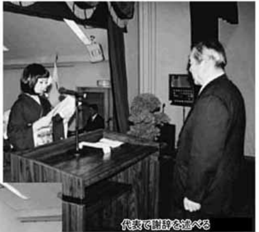
代表で謝辞を述べる