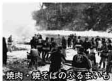
焼肉・焼そばのふるまいも