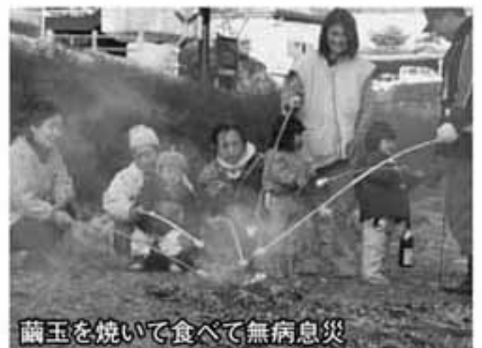
藪玉を焼いて食べて無病息災