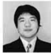
④③②① ④楽しく送れる人生にする