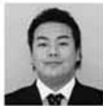
④③②① ④日々を楽しく過ごす