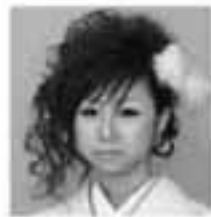
④③②① ④美容室の経営者になる