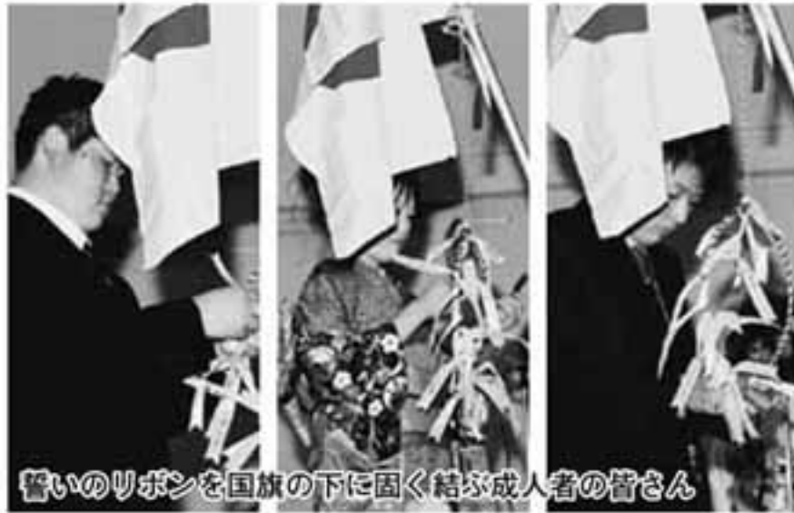
誓いのリボンを国旗の下に固く結ぶ成人者の皆さん

1月7日に、鯉々鰻ランド会館において、成人式が挙行されました。前日の雪で足元が悪い中、該当成人者32名中、22名が出席し、ご来賓が見守る中、厳粛に執り行われました。誓いも新たに社会へと羽ばたく皆さんの、今後のご活躍をお祈りいたします。