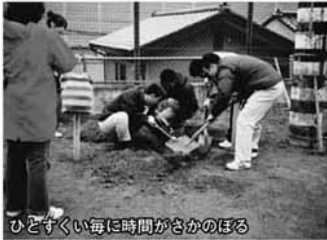
ひとすくい毎に時間がさかのぼる

先日、ある人たちが同窓会を開催しました。卒業して20年という節目を機に開催された、昭和62年度中里中学校卒業生の同窓会です。この同窓会は、なんと、事前に校庭の片隅を掘ると