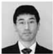
④③②① ④自分なりに満足する人生