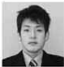
④③②① ④全力に精一杯生きる