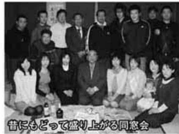
昔にもどって盛り上がる同窓会

時代の目標や、将来の自分にあてた本人や親からの手紙の他、先生が、教え子たちと一緒に飲むための、ウイスキーなども入れてありました。試飲したら酸っぱかったとか、それは、初恋の味だったのでしょか。