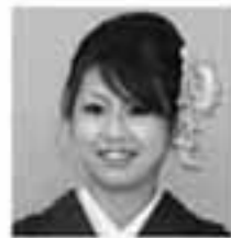
④③②① ④何でもできる主婦になる