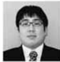
④③②① All for one! ④One for all!