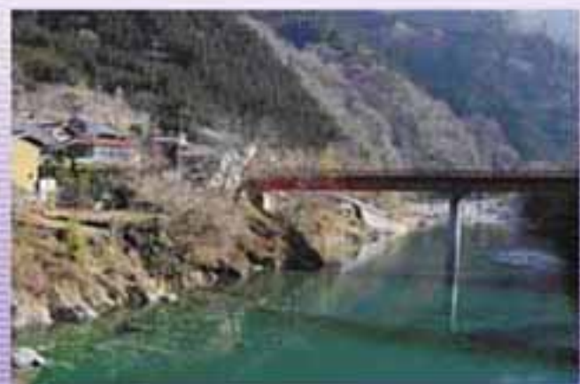
今年の正月前半は穏やかで、 満水近いダム湖の水もきれいな 風景が広がっています。