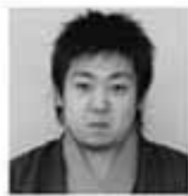
④③②① ④マイホームを建てる