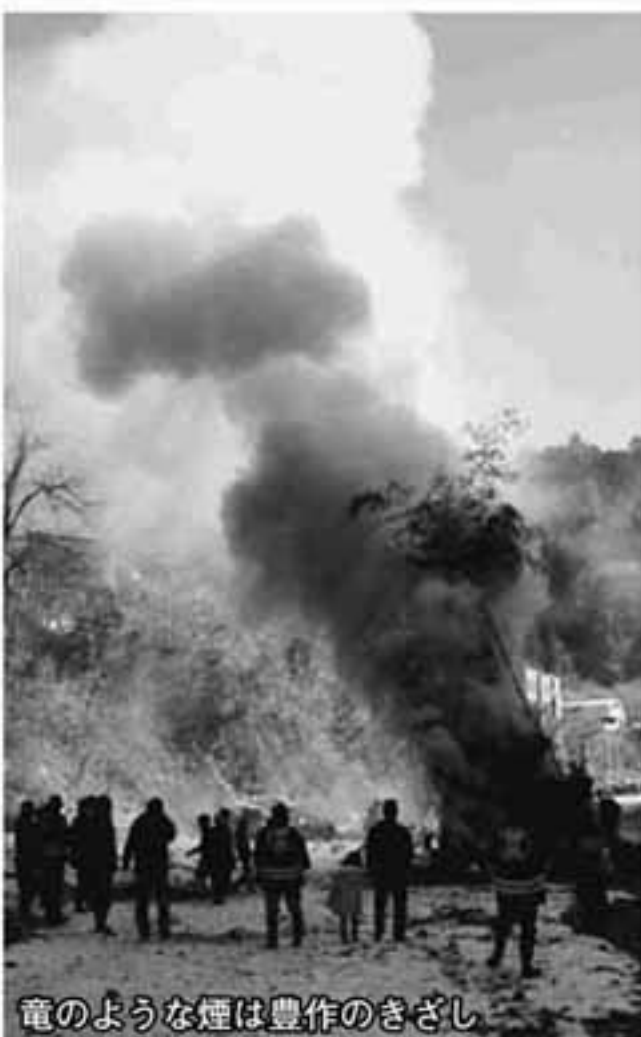
竜のような煙は豊作のきざし