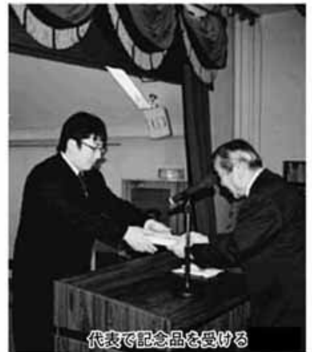
代表で記念品を受ける