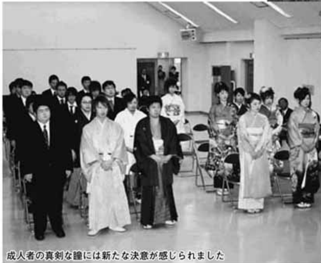
成人者の真剣な瞳には新たな決意が感じられました