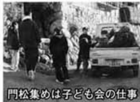
門松集めは子ども会の仕事