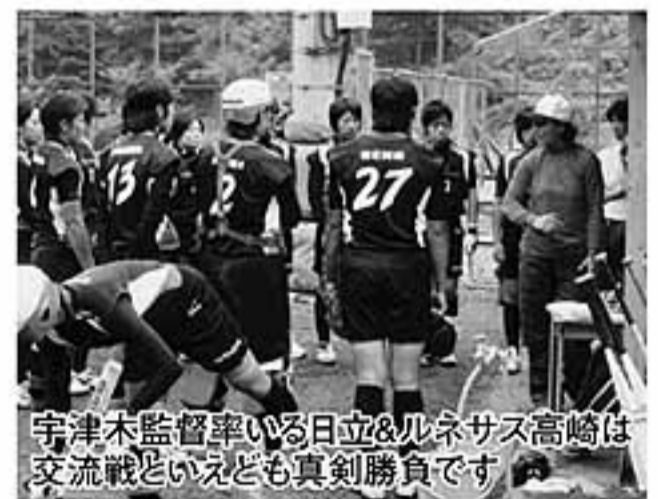
宇津木監督率いる日立&ルネサス高崎は交流戦といえども真剣勝負です