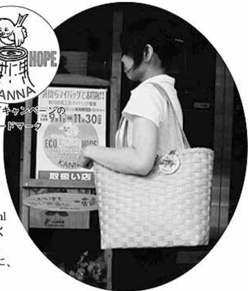
マイバッグはデザインもステキです