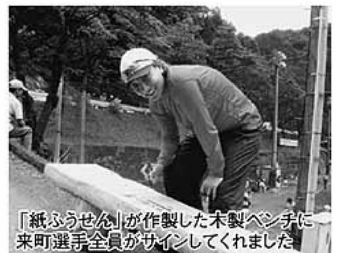
「紙ふうせん」が作製した木製ベンチに来町選手全員がサインしてくれました

台風による状況変化に、臨機応変に対応した実行委員会や関係者の皆さん。大変お疲れさまでした。