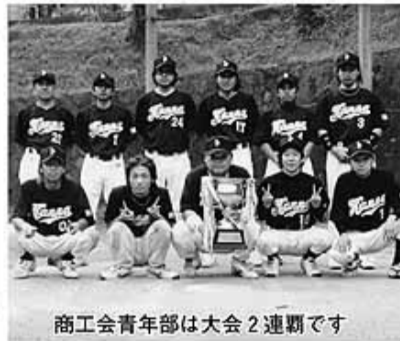
商工会青年部は大会2連覇です

球チームが参戦し、若者に負けじと白球を追いかけました。 ▽成績 優勝 商工会青年部 準優勝 How are you ▽ホームラン