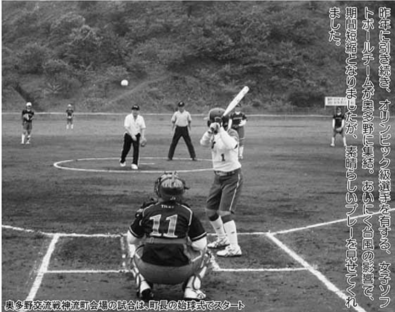
奥多野交流戦神流町会場の試合は、町長の始球式でスタート

昨年より引き続き、オリンピック級選手を有する、女子ソフトボールチームが奥多野に集結。あいにく台風の影響で、期間短縮となりましたが、素晴らしいプレーを見せてくれました。