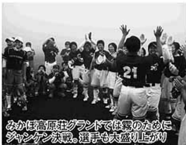
みかほ高原荘グラウンドでは霧のためにジャンケン決戦。選手も大盛り上がり

台風による状況変化に、臨機応変に対応した実行委員会や関係者の皆さん。大変お疲れさまでした。