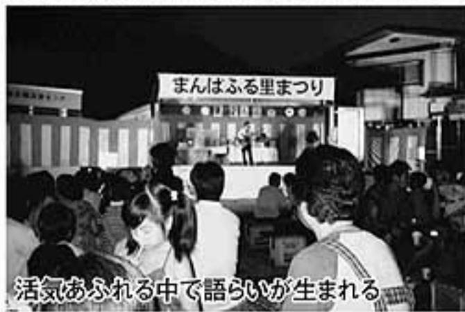
活気あふれる中で語らいが生まれる