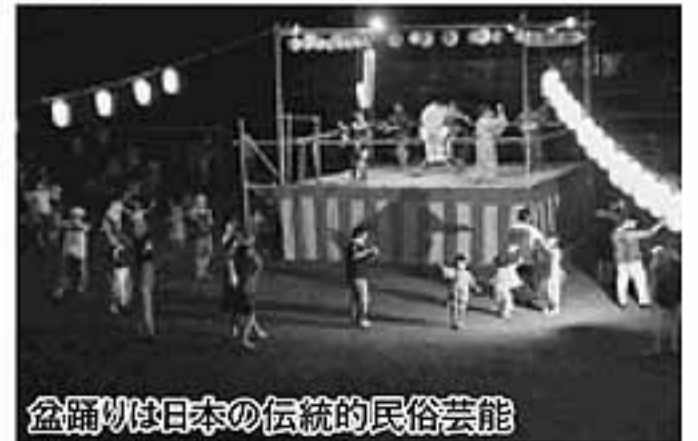
盆踊りは日本の伝統的民俗芸能