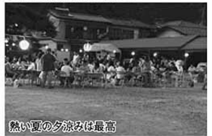
熱い夏の夕涼みは最高