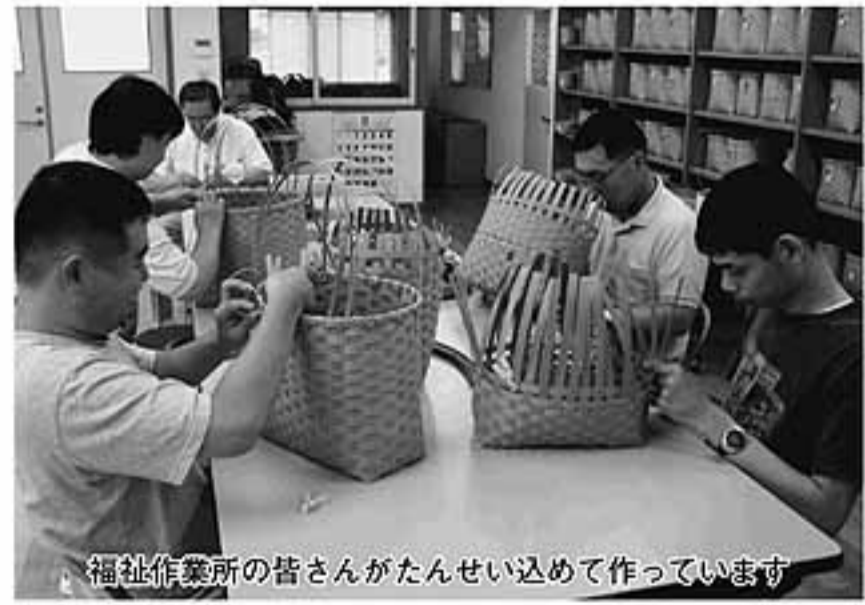
福祉作業所の皆さんがたんせい込めて作っています