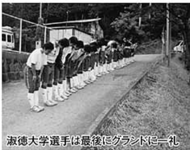
淑徳大学選手は最後にグラウンドに一礼