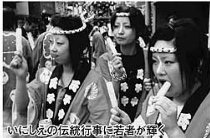
いにしへの伝統行事に若者が輝く