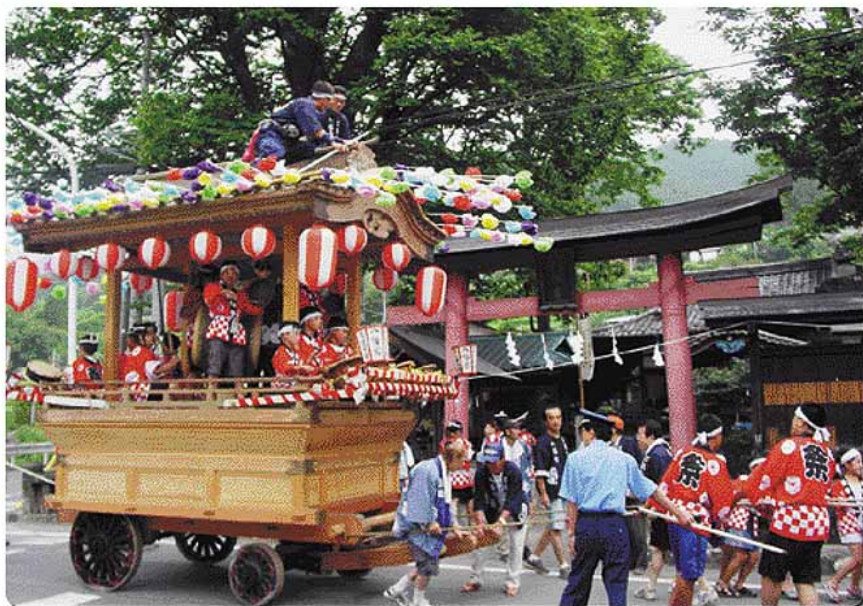
8月15日八幡神社例大祭