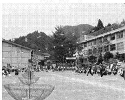
ホールインワンゲーム