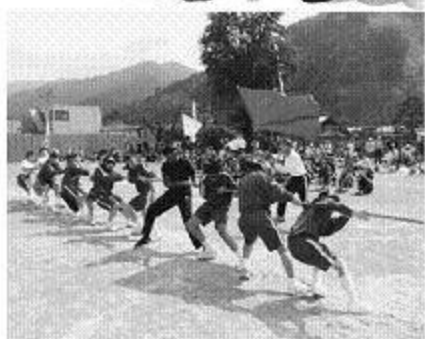
中学生の挑戦 綱引き