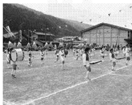
小学生全児童による 鼓笛 (2)