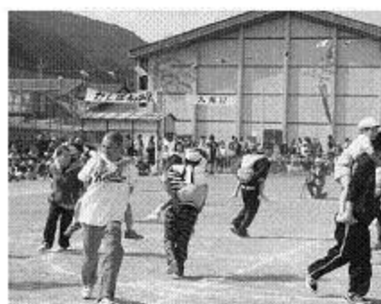
保育所親子競技 騎馬戦