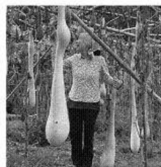
ひょうたん畑にて

人たちにどんどん自分の誇りを伝えてほしいです。次に来る明日を作るのに、必要な知恵やヒントを与えてあげられるのはたくさん人の経験の積りで生きてきた人たち。「小さい頃よりも楽しいと思える事が少なくなってきた」どうか、得意な事や頑張ってきた事など、教えて頂きたい。