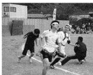
各種団体リレー決勝(一般男子)