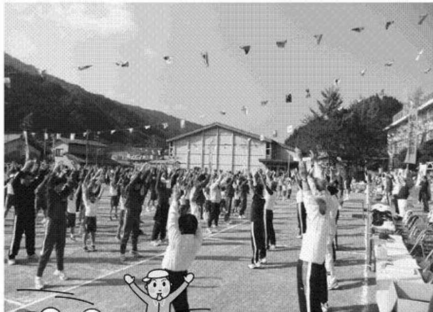
合同でのラジオ体操

さわやかな天候に恵まれた10月9日、万場小学校校庭において神流町体育祭が開催されました。体育祭は全町民が主役の行事と言えます。開幕を告げる放送後、プラカードを先頭に選手団の入場行進があり、会場に選手が整列しました。開会式では、体育功労者表彰、小学生による選手宣誓、ラジオ体操の後、小学生による徒競走から競技の火ぶたが切られました。最後は、10年という節目を迎えた神流KTRによるソーラン節で締めくくられ、楽しい一日が無事に終了しました。