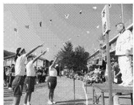
小学生による選手宣誓