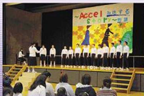
11月3日 中里中学校文化祭 した。第4回「水明祭」が行われま