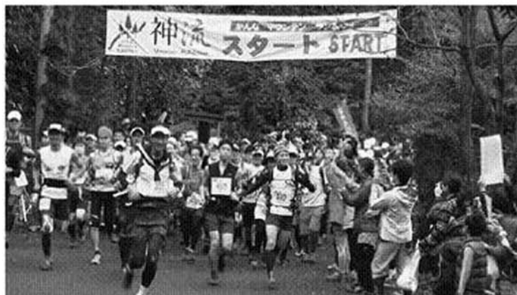
スタートを切るランナー

準備作業から後片付けまで総勢380名を超える多くのボランティアの方々にご協力を賜り、また、沿道では沢山の町民の方々に応援していただき、盛大かつ大成功のうちに大会を終了できたことに対し、心より感謝申し上げます。