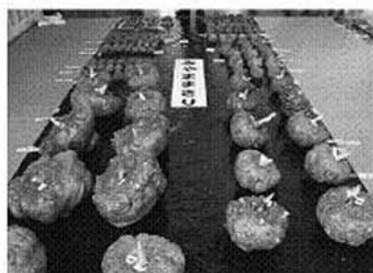
こんにゃくの生玉共進会

売、自衛隊の豚汁サーブスが行われた他、復興支援サンマを配付しての募金が行われ、135,474円の義援金が集まりました。 体育館の中では日頃の成果の発表の場でもある文化部会の発表会が行われ、書道や絵画、陶芸等の作品展示と、ステージ上では舞踊、社交ダンス、フラダンス、カラオケ等の発表会があり、たくさんの方でにぎわいました。