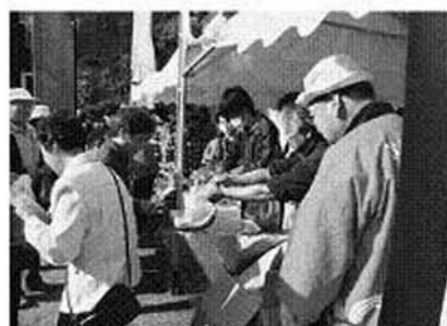
復興支援サンマの配布