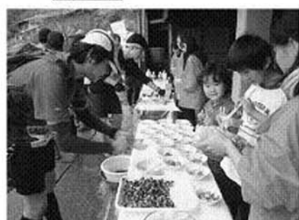
持倉エイドステーション