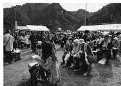
大勢の方が訪れた中学校校庭