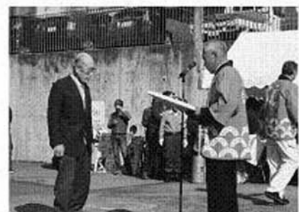
長年の功績に対し、神流町農業研究会会長より感謝状を受けるさん(万一)