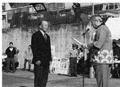
「こんにゃく生玉共進会 切玉花咲の部」で実行委員会会長表彰を受けるさん(万一)

暗れわたった秋空が広がる11月13日(日)中里中学校校庭、体育館及び中里合同庁舎を会場に、毎年恒例の恐竜王国秋まつりが盛大に開催されました。 校庭では、産業部会の舞茸ごはん・椎茸ごはん・うどん・そばの食べ放題や観光特産物、サウルスクン焼き、焼き鳥、飲み物の販売、酒類の試飲販売