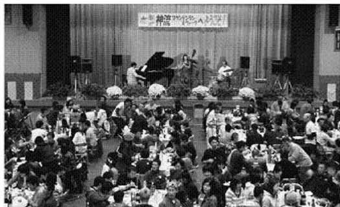
大盛況のウェルカムパーティー