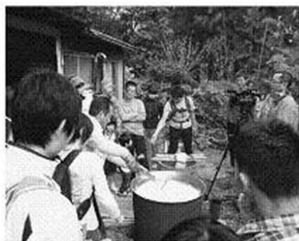
山村体験 豆腐作り