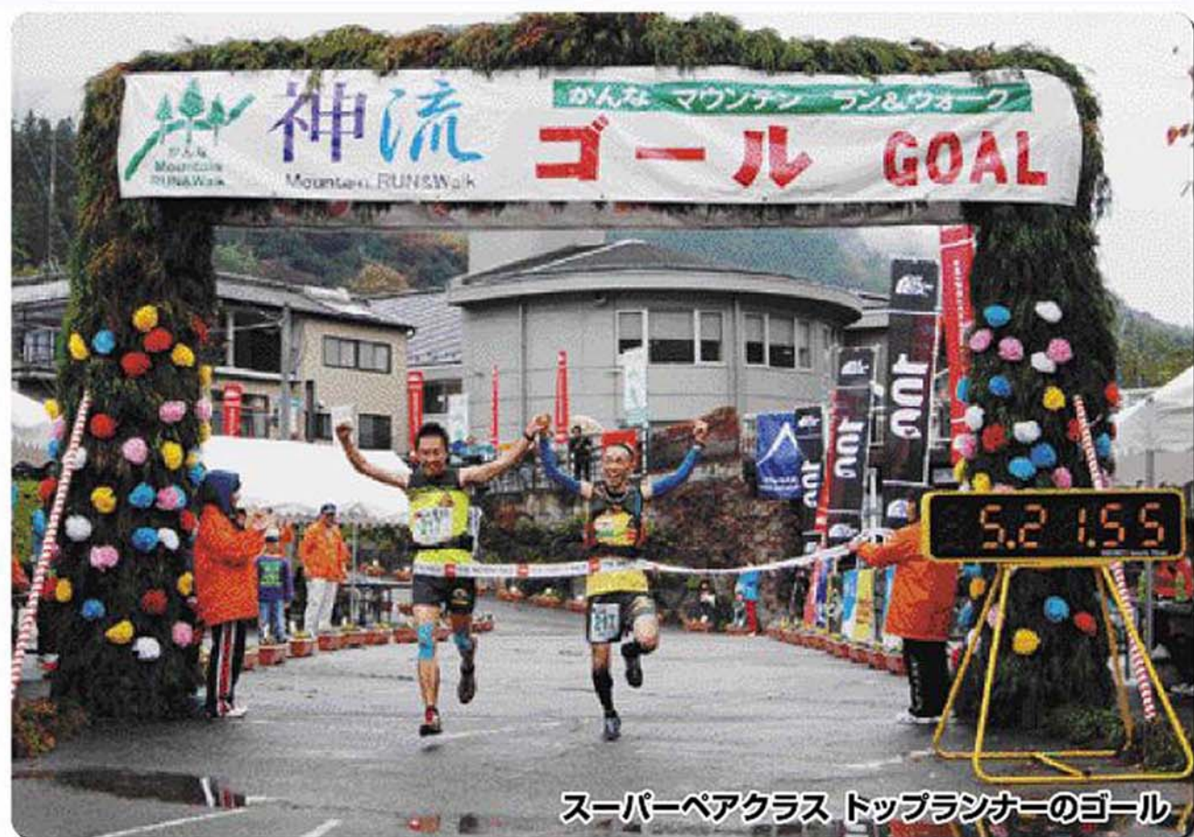
スーパーベアクラス トップランナーのゴール