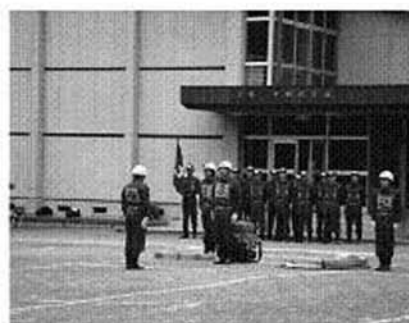
第1分団 小型ポンプ操法