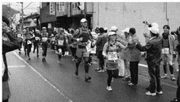
温かい声援の中を駆け抜けるランナー