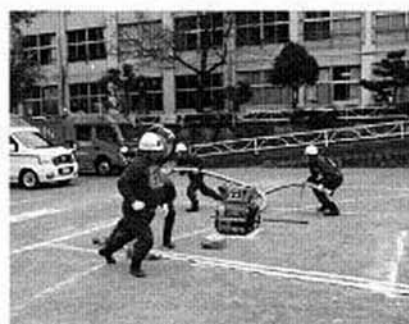
第5分団 小型ポンプ操法