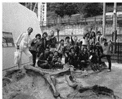
特別企画 恐竜センター見学