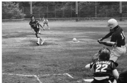
ナイスピッチング!