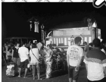
かたる会七夕祭り 8日(土)

町では、8月の町内の祭りを「神流の夏祭り」と称して、お盆休暇を中心に移動する行楽客や帰省する出身者を対象に、宣伝活動を行いました。