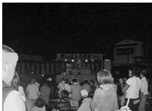
まんばふる里まつり 14日(金)