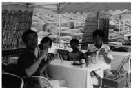
アユの塩焼きも大繁盛

町では、初の試みとして8月の町内の祭りをひとつくりにし、「神流の夏祭り」と称して宣伝活動を行いました。