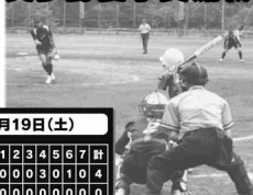
平成18年7月の試合から

今年の夏も日本女子ソフトボール奥多野夏季交流戦が行われ、総合グラウンドで熱戦が繰り広げられました。本町では、7月19日(土)と20日(日)の日程で行われ、対戦結果は、スコア表の通りです。