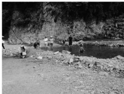
ふるさと築付近で遊ぶ行楽客