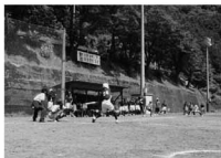
今年の交流戦 戸田中央病院VS日立マクセル

〔藤岡市多野郡大会〕 平成20年度藤岡市多野郡 中体連夏季大会が平成20年 7月19日から22日まで開催 されました。結果をお知ら せいたします。 (県大会出場の種類と選手 のみ)