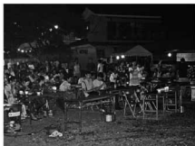
ゆかた姿の女性も多く.....

「神流の夏祭り」で、それぞれの主催団体がイベントに注いだ力こそ「ふるさと力」です。きつと多くのお客様の心の中に「ふるさと神流町」が刻まれたことでしょうか。