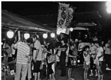
バザーコーナーも大にぎわい