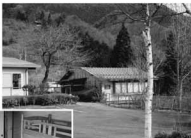
◀ ペット同伴宿泊機と改装中の室内

また、「ペット同伴宿泊機」改修工事については「千客万来支援事業」として経費の半分は群馬県の補助金でまかなわれます。