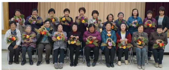
みなさんきれいな作品ができました