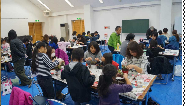
子どもも大人も真剣に