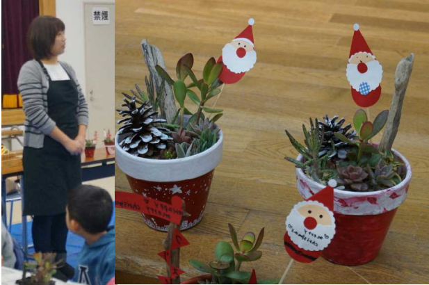
かわいらしいのができました